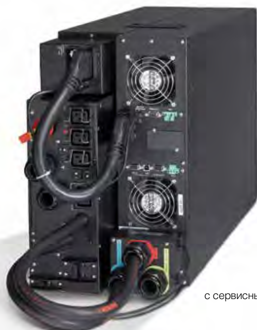
9PX 11 кВА с сервисным байпасом.

ЖК-дисплей 9PX наклоняется под углом до 45° для обеспечения более удобного просмотра